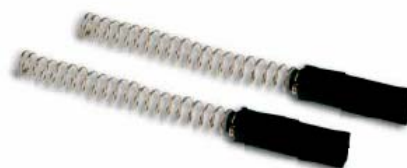
Art. 55265 Für / pour Gravograph 6 x 6 mm