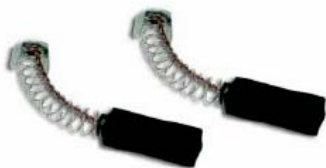
Art. 1036 Für alle Varga / pour tous les Varga