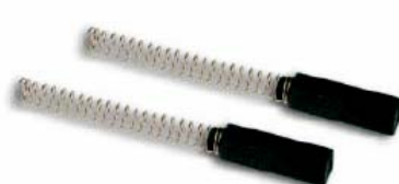
Art. A3169 Für / pour Gravograph 5 x 5 mm