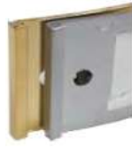
Schilderträger in den Farben gold oder edelstahl Cadre en couleur or ou acier inox