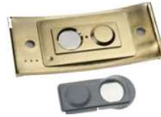
Verdrehsicherer Magnet Magnétique anti-torsion