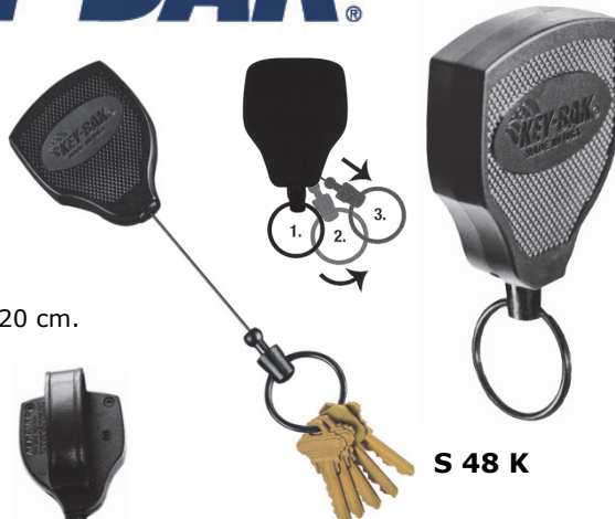
S 48 K