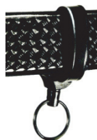
S 48 K-LEK

Le modèle plus fort de KEY-BAK® avec une corde en kevlar longueur 120 cm. On peut accrocher au boîtier pour un trousseau lourd, S 48 K avec une pince de fixation pour ceinture, S48 LEK avec courroie en cuir